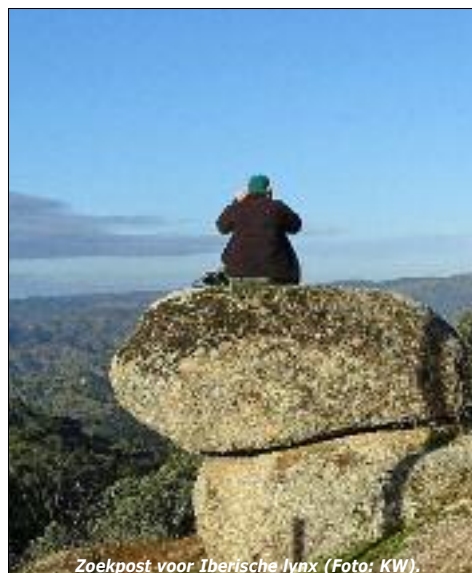
Zoekpost voor Iberische lynx (Foto: KW).

Het spotten van Iberische Lynx, grote zoogdie-