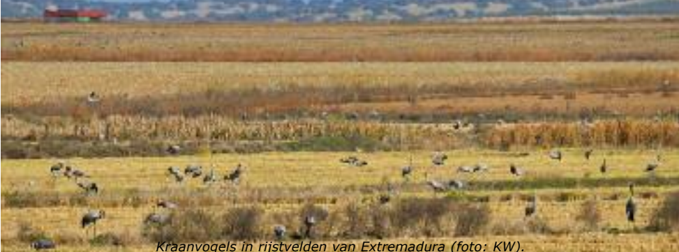
Kraanvogels in rijstvelden van Extremadura.

Overall lopen kraanvogels. Familiegroepjes zoeken naar rijst, eikels en bloembollen. Het voedsel is energetisch rijk en het is dus de moeite waard om duizenden kilometers te reizen, van het verre Rusland tot in Extremadura.