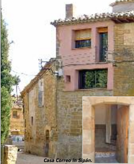
Casa Correo in Sipán.

Roofvogels kijken vanaf het terras? ARAGON Naturreizen heeft een authentiek, gemoderniseerd huis aan de voet van de Pyreneeën in Spanje. U kunt wandelen, genieten van de natuur, vogels kijken en meer.