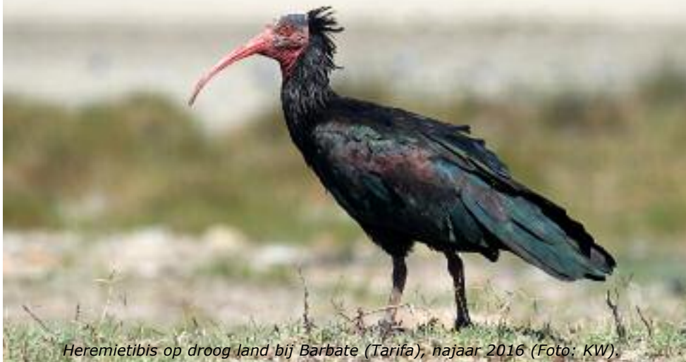
Heremietibis op droog land bij Barbate (Tarifa), najaar 2016.

De heremietibis ziet er vreemd en mooi uit. Het is een van de meest bedreigde en zeldzaamste vogels ter wereld. In het wild zijn er rond de 140 paar. Met de kolonie dichtbij Tarifa gaat het goed, met 20 paar en jaarlijks 25 jongen.