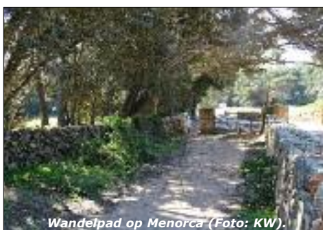
Wandelpad op Menorca.

Dag 8. Retour vliegveld vliegveld Mahon.