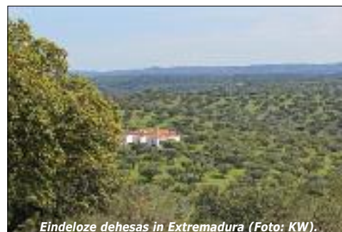
Eindeloze dehesas in Extremadura (Foto: KW).

Het stuwmeer Arrocampo (Extremadura) is een wonderlijke omgeving met vogels als purperreiger, kleine zilverreiger, dwergarend, grijze wouw, purperkoet, snor, grote karekiet, Iberische klapekster plus het "gewone" spul als bijeneter, hop, graszanger, Cetty's zanger, grauwe gors enz. Veel zomervogels zijn ook in de winter te zien.