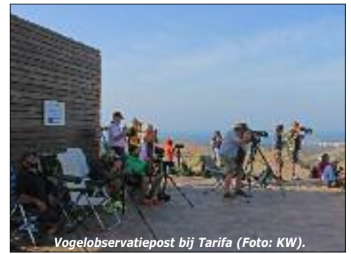
Vogelobservatiepost bij Tarifa.

Tarifa is intensief vogels kijken. Iedere ochtend vliegen honderden dwerg- en slangarenden, aasgieren, zwarte ooievaars en nog veel meer langs de observatieposten. We zien dat Afrika dichtbij is. In de middag zoeken we de omgeving af voor steltlopers, zeevogels en zoeken Afrikaanse grauwe buulbuul, Ruppels Gier, Heremietibis en Kaffergierzwaluw.