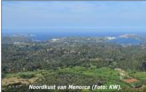
Noordkust van Menorca.

Overal op het eiland kunne interessante soorten opduiken, het is dus zaak om altijd opletend te blijven. Rode patrijs, Provencaalse grasmus, blauwe rotslijster, grauwe gors en Tekla leeuwerik broeden op veel plaatsen. Audouin's - en dunbekmeeuw, vale - en Kuhl's pijlstormvogel zitten op zee.