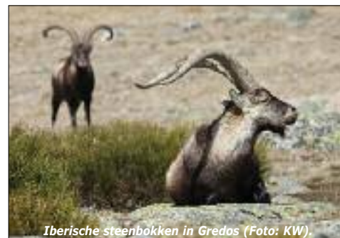
Iberische steenbokken in Gredos.

De Dehesas van Extremadura staan in april vol in bloei. Hier leven vogels die elders in Europa moeilijk te vinden zijn: grijze wouw, monniksgier, Spaanse keizerarend, havikarend, roodstuitzwaluw en blauwe ekster. Het Nationaal Park Monfragüe is het indrukwekkendst omdat hier de vogels het best te zien zijn: nesten van oehoe, aasgier, vale gier, monniksgier, zwarte ooievaar en raaf zijn met telescoop goed te zien. De steppen zijn uitgestrekt met kleine trap en grote trap (baltsend!), kalenderleeuwerik, Iberische klapekster, grauwe kiekendieef, witbuik- en zwartbuikzandhoen. In het Middelste eeuwse Trujillo broeden ooievaar en kleine torenvalk.