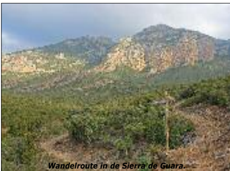
Wandelroute in de Sierra de Guara.

Indeling: bgg. entree, berging en trap. 1e verd. woonkamer (boeken, houtkachel), keuken, ruime badkamer met douche en toilet. 2e verd. slaapkamer met 2 persoons bed, slaapkamer met 2x1 persoons bed. Elektrische verwarming. Dakterras. Eigen parkeerplaats.