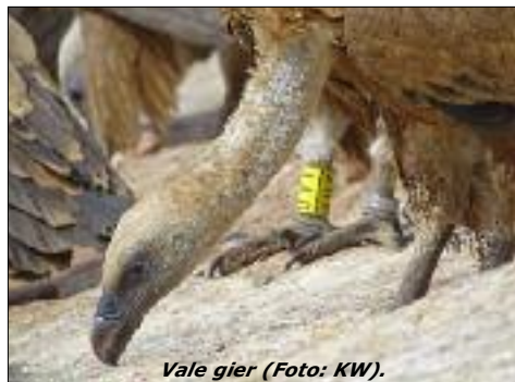
Vale gier.

Noordoost Spanje biedt zeer verschillende landschappen in een relatief klein gebied: wetlands en zee in de Ebro Delta, droge steppen bij de Monegros en Belchite en het Mediterrane berglandschap aan de zuidrand van de bergen van de Pyreneeën (Aragón). Dit zijn stuk voor stuk topgebieden voor vogelaars, iedere plek heeft zijn speciale vogels en een eigen charme. Spannende soorten zijn Audouin's meeuw, Dunbekmeeuw, Kwak, Ralreiger, Dupont's leeuwerik, zwarte tapuit, Rode Rotslijster, Dwerg- en Slangenarend, lammergier en vale gier.